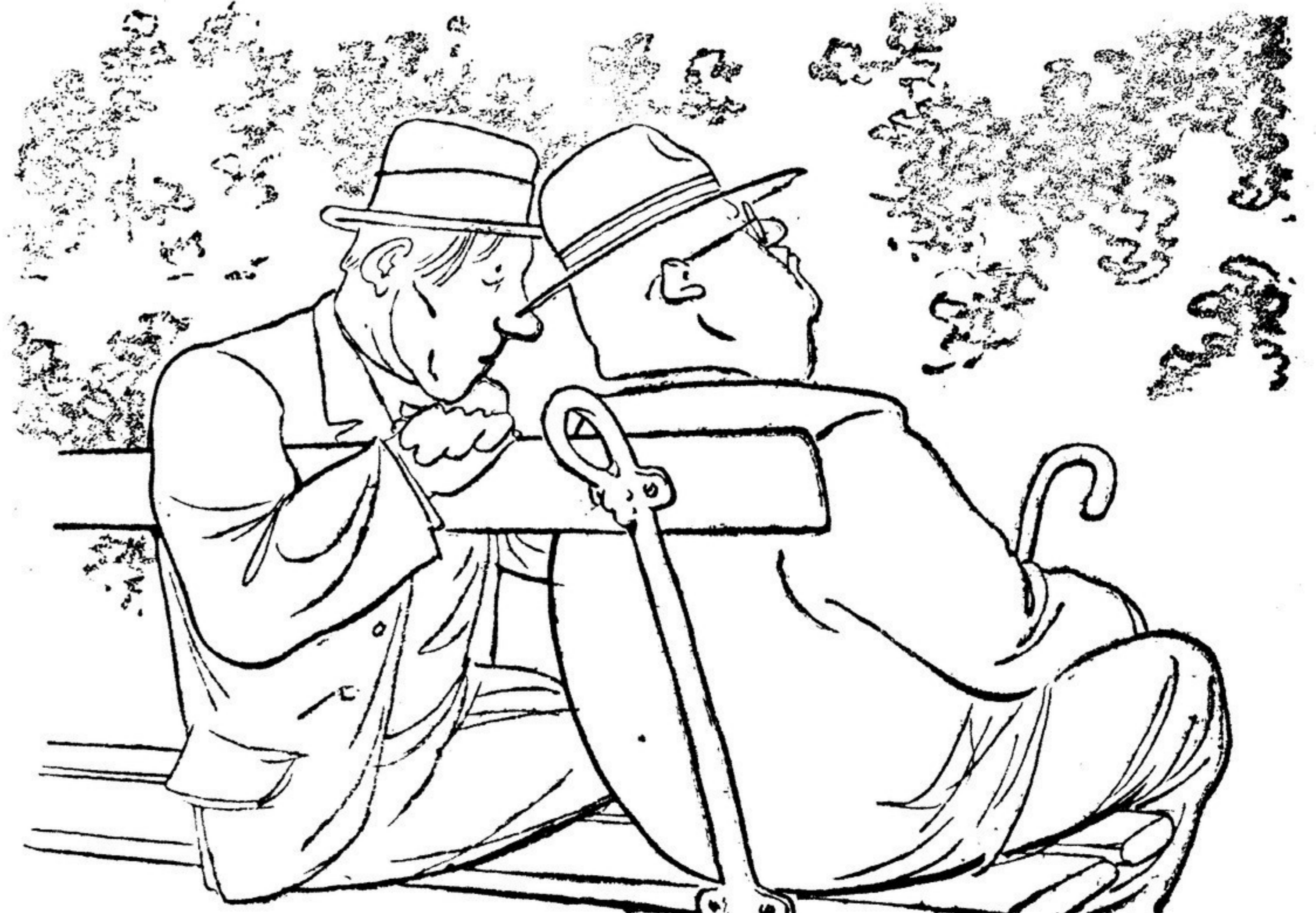
Рис. К. Елисеева

«На второй день» «Что тебя сегодня волнует?» «После приема в союз... ничто».