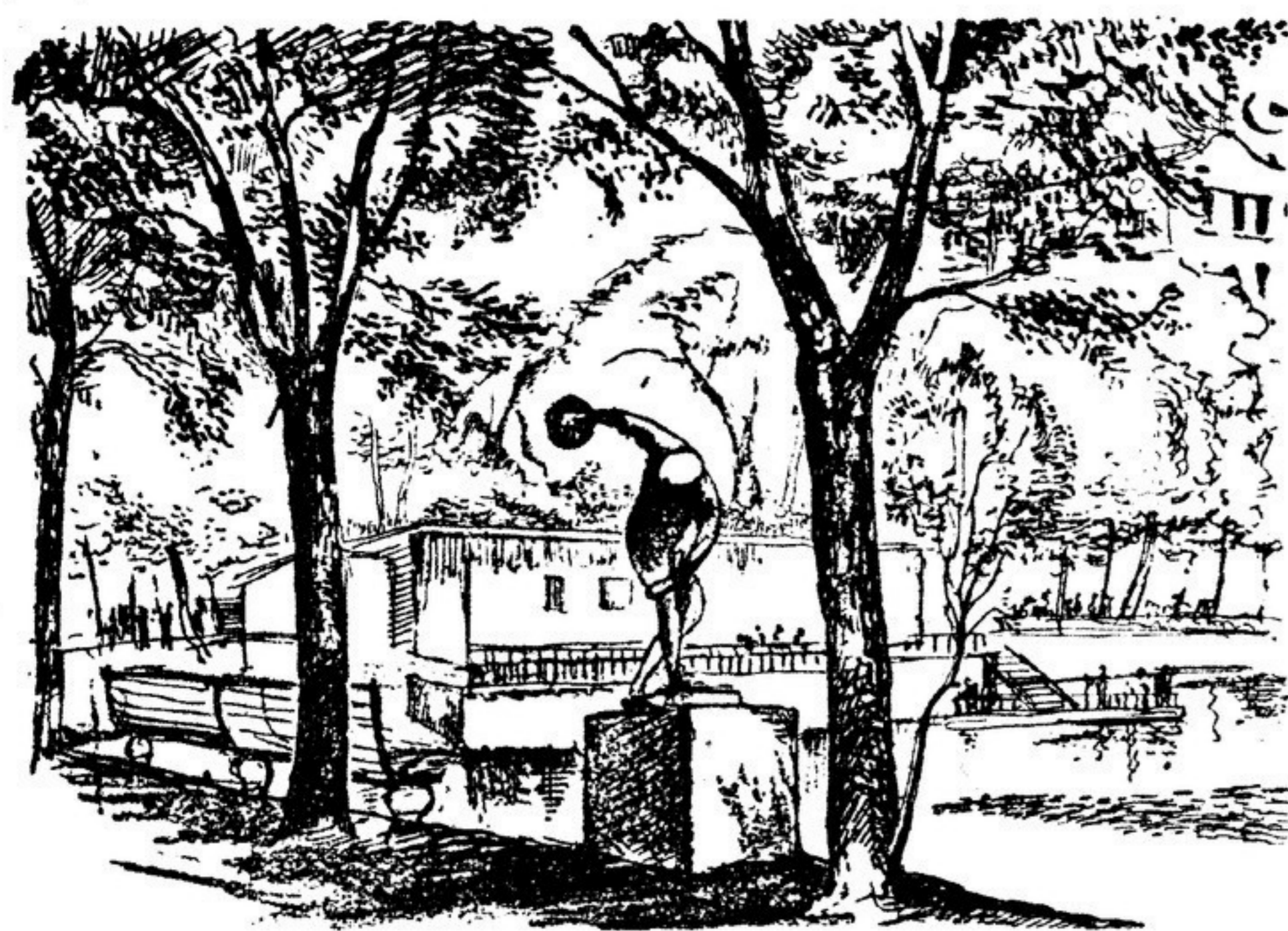
МОСКВА Пionenские пруды.