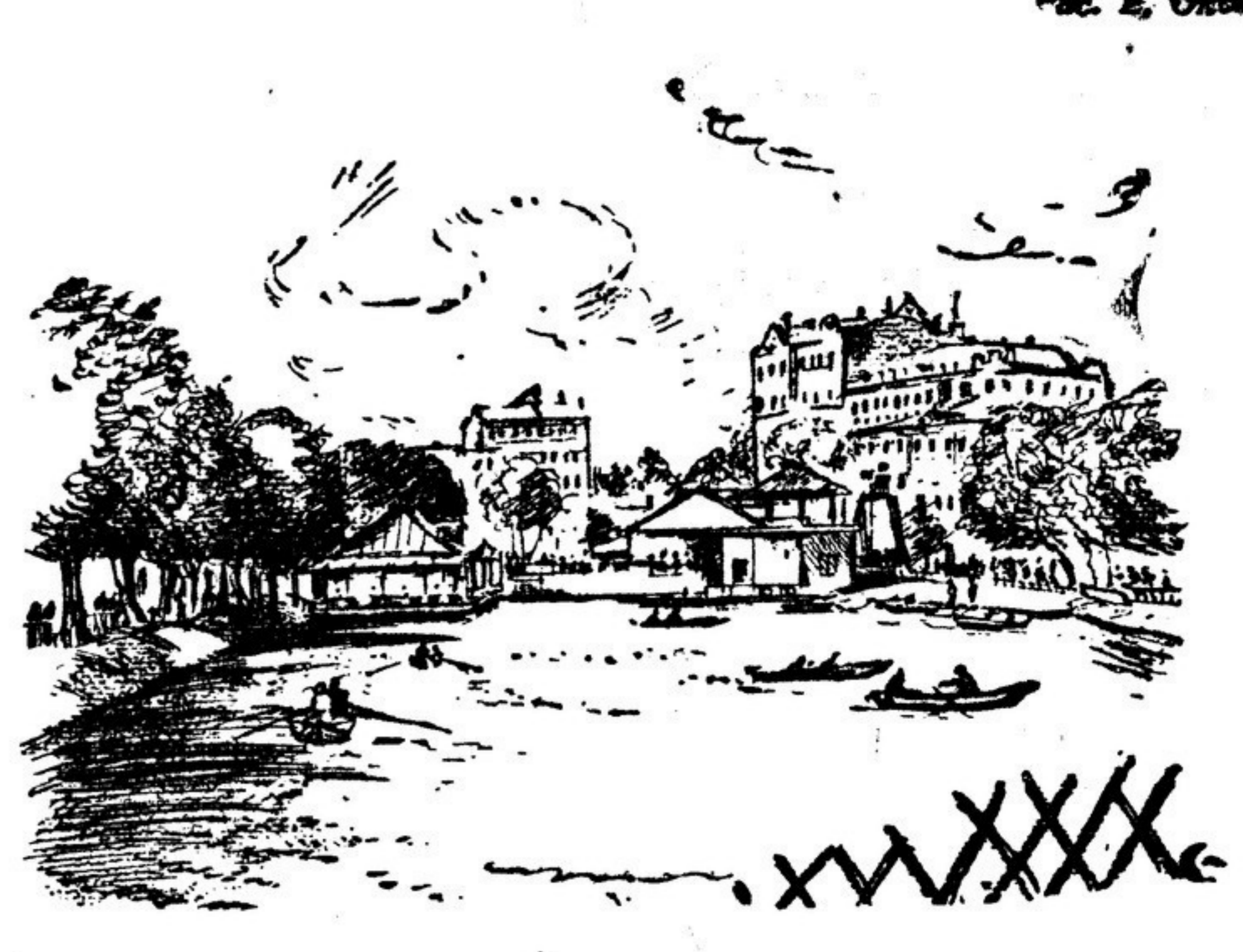
МОСКВА. Чистые пруды.